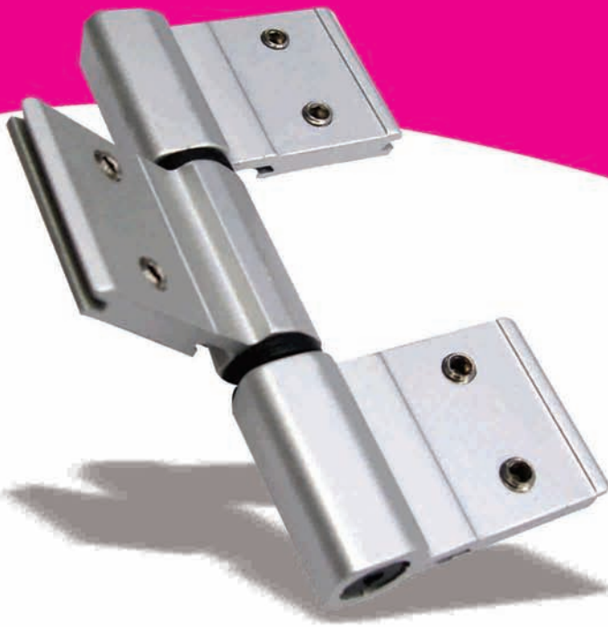
Detalle de Aplicación Línea Abatir 3200